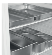
Conçu pour des bacs GN1/1, non fournis