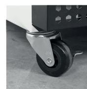
Roulettes solides en option