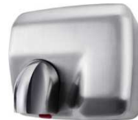
Inox Brossé (Réf. WINDO A SE)