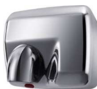
Inox Brillant (Réf. WINDO A IE)