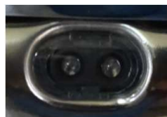
Led de fonctionnement bleue