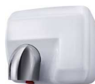
Poudré Blanc (Réf. WINDO A BE)