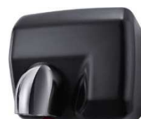
Poudré Noir (Réf. WINDO A NE)