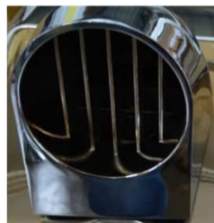
Buse d'air protégée par une grille